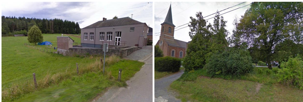
Figures 2 et 3 : Vue des deux sites le long de la rue St-Barthélemy.