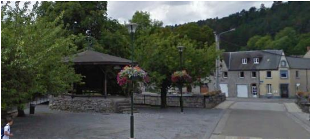
Figure 1 : Kiosque de Gemelle