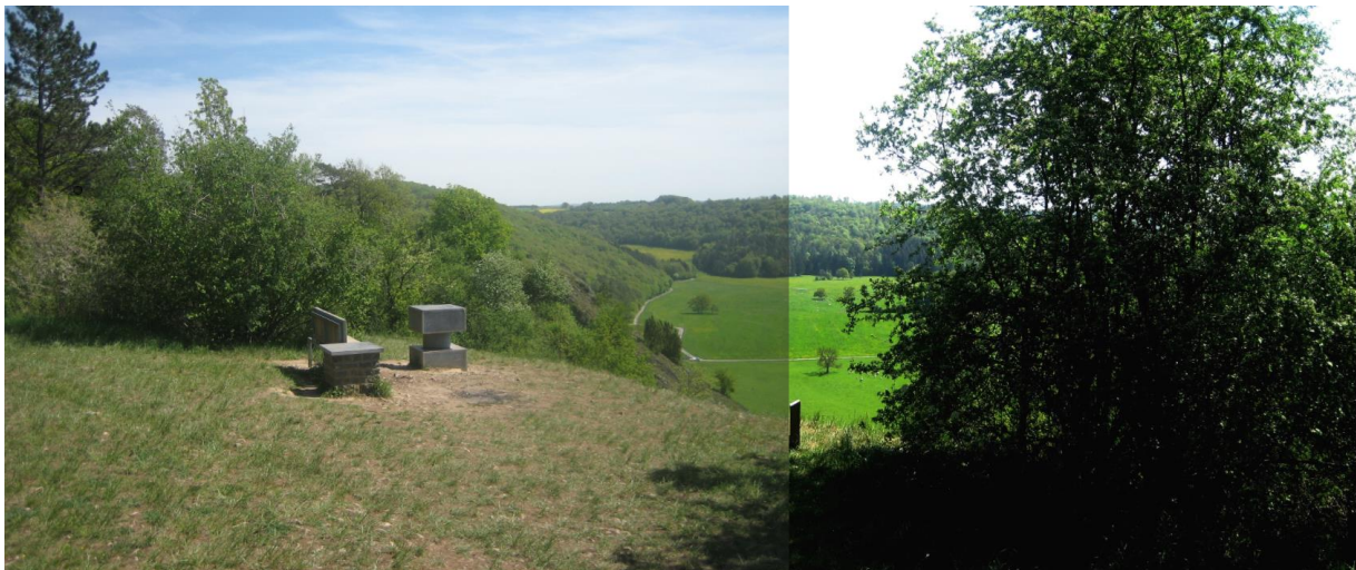
Figure 2 : Han-sur-Lesse – Abords du Belvédère