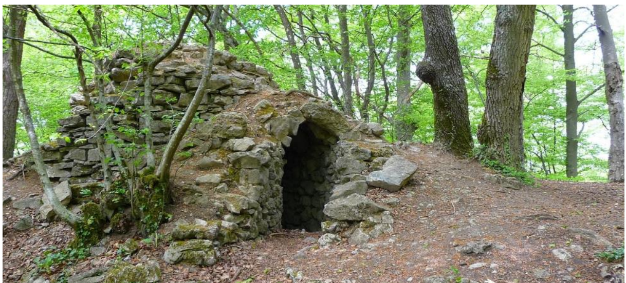
Figure 3 : Auffe – Ruine de la Tour de l'Ermitage